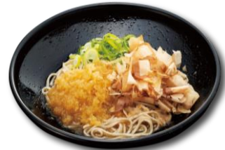
●福井名物 越前おろしそば(冷) 440円