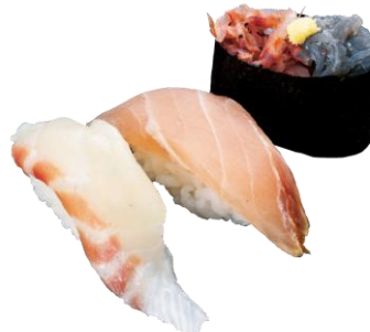
●春三昧第一弾 (アセロラ真鯛/かじき/生しらす生桜えび合盛り軍艦) 590円