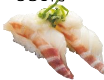
●アセロラ真鯛® だしとろろのせ 440円