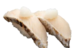
●炙りさわら 柚子塩漬け 390円