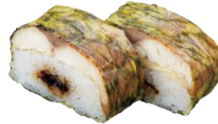
●福井名物 焼き鯖の押し寿司 390円