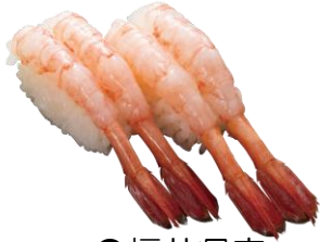
●福井県産 福井甘えび 740円

■販売店舗：回転寿司業態「にぎりの徳兵衛」、「海鮮アトム」、「海へ」各店 ※稲沢店ではメニュー内容が異なります。