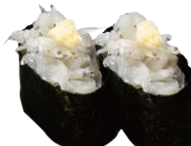
●広島県産 生しらす軍艦 340円