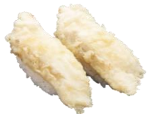
●アセロラ真鯛® 天ぷら 440円