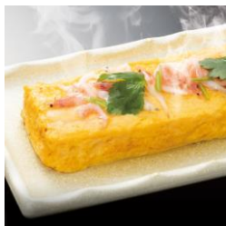
●桜えびとしらすの 餡かけだし巻き玉子 540円