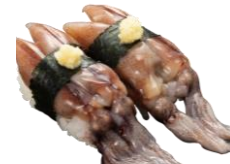
●兵庫県産 生ほたるいか 340円