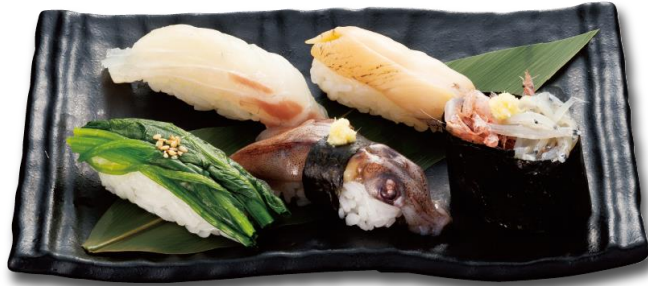
●春の特選五貫盛り第一弾 (アセロラ真鯛/赤梅貝/ほうれん草漬け/ 生ほたるいか/生しらす生桜えび合盛り軍艦) 930円