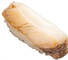
●福井県産 赤梅貝一貫 290円