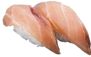
●福井県産 かじき 440円