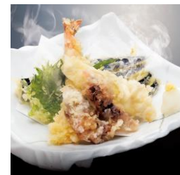
●春の天ぷら盛り合わせ (アセロラ真鯛/ほたるいか/えび/なす/大葉) 590円